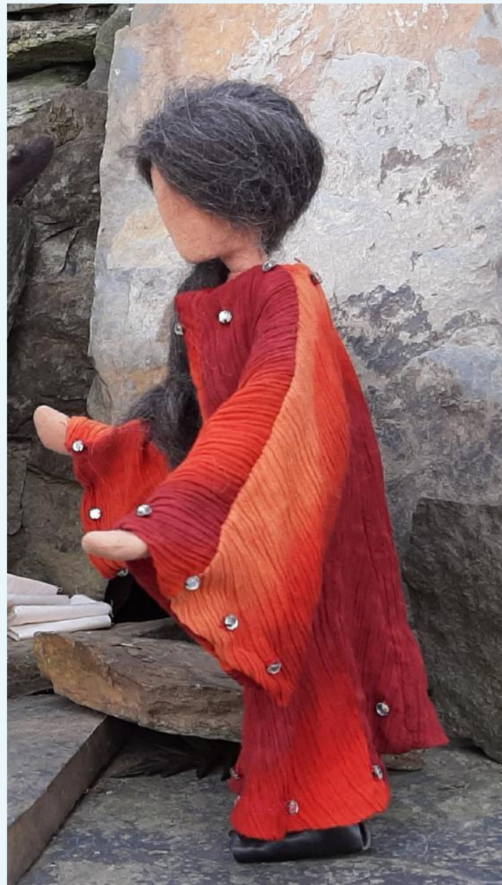
María von Magdala .....